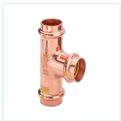
Profipress G-Té avec SC-Contur modèle 2618 article 346 959